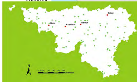
Localisation en Wallonie des projets éoliens traités par le DEMNA.

Afin de garantir une évaluation adéquate des incidences du projet éolien sur l'avifaune et les chauves-souris, la DGARNE insiste pour que des études préalables précises soient menées. Un protocole d'étude détaillé a été établi pour ces 2 groupes d'espèces ainsi que les justifications scientifiques des options retenues. Des propositions sont également apportées en matière de compensation et d'atténuation des impacts.