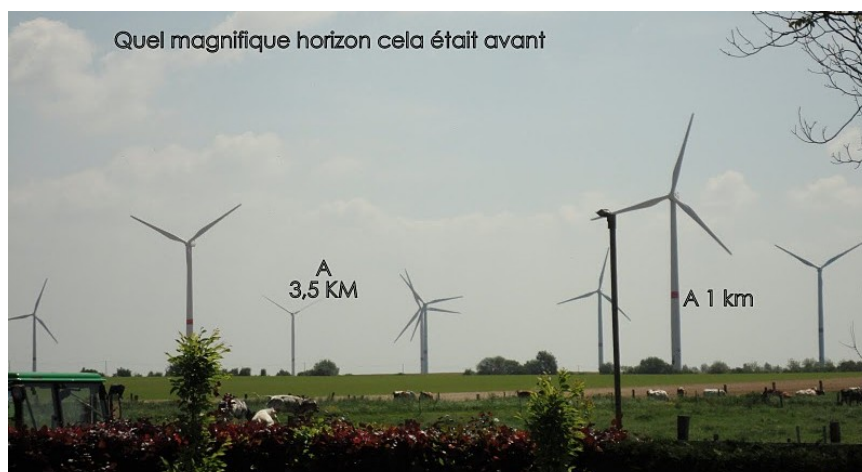
Vue de la maison de Paul ADAM Rue du Ponceau 1360 Thorembais-st-Trond

Les riverains souhaitant faire des remarques sur ce projet disposent de 15 jours à dater de cette réunion pour faire parvenir leur courrier. Le projet actuel et l'étude d'incidences précédente sont consultables via les sites des communes de Gembloux et de Walhain.